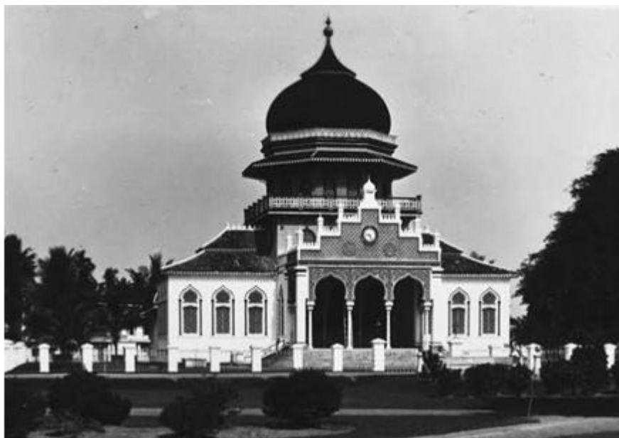
Gambar 2. Masjid Raya Baiturrahman pada tahun 1889 M

Masjid Jami' Baiturrahman, setelah dibakar Belanda, kemudian dibangun hanya memiliki satu kubah, namun untuk menarik simpati rakyat Aceh karena perang Aceh melawan Belanda belum juga reda, maka pada tahun 1935 Belanda memperluas lagi Masjid Jami' Baiturrahman dan menambah dua kubah lagi di sisi kanan dan kiri. Berikut masjid Jami' ini berubah namanya Masjid Raya.